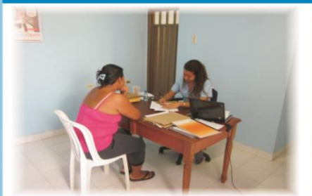
2 CONSULTORIOS MEDICOS