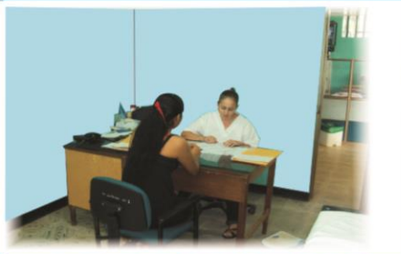
3 CONSULTORIOS MEDICOS