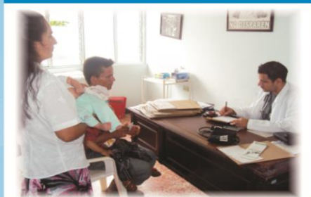
2 CONSULTORIOS MEDICOS

La E.S.E. Fabio Jaramillo Londoño cuenta con consultorios para la atención a la Salud del paciente ambulatorio, donde se ofrece orientación, diagnóstico y tratamientos médicos a toda la comunidad.