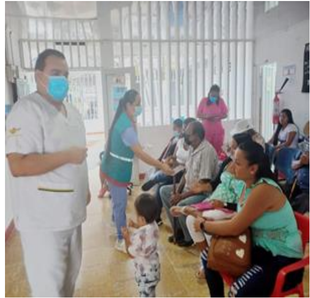
EVIDENCIA FOTOGRAFICA ATENCIÓN DOMICILIARIA POR ENFERMERIA RESOLUCION 521 DEL 2020 – IPS SOLITA