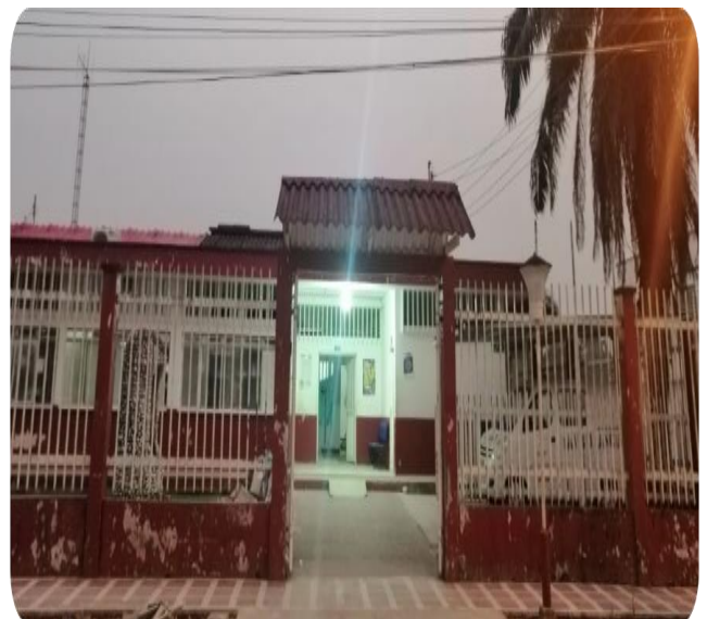
IPS de Solano