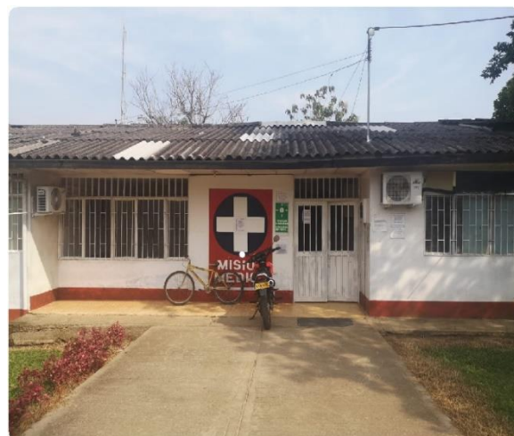
IPS de San Antonio de Getuchá