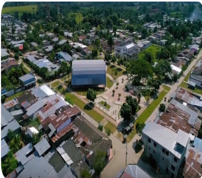
Vista área de Solano

IPS MILAN Calle 3 No. 6-72 Tel 4306050 Cel: 320-8557187