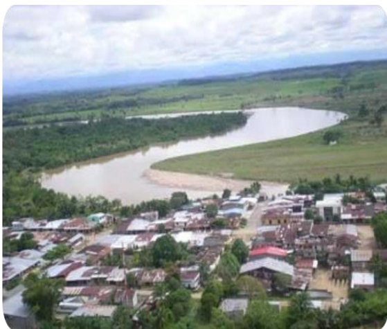
Vista aérea de Valparaíso

El municipio de Valparaíso se encuentra ubicado en el suroccidente del departamento del Caquetá y su cabecera municipal en la margen derecha del río Pescado; dista de Florencia 72 Km de los cuales 20 son asfaltados, la base de la economía de es el ganado en especial la producción láctea, la población del Municipio de Valparaíso es de 11.629 personas aproximadamente.