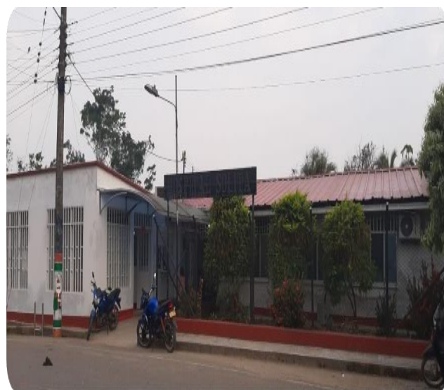
IPS de Solita