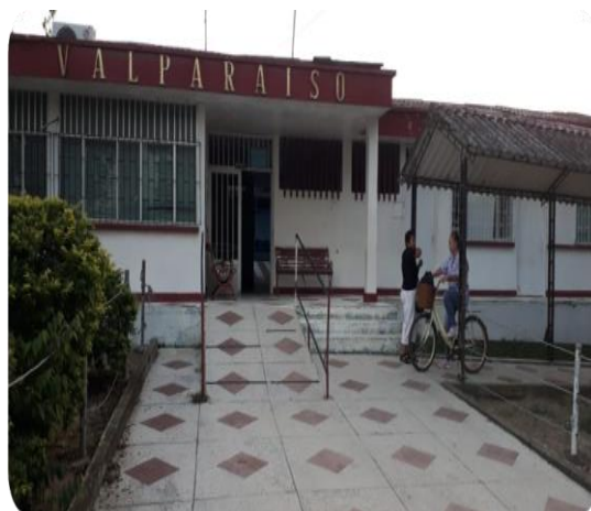
IPS de Valparaíso