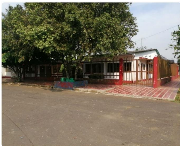
IPS de Milán

El Municipio de Milán está localizado en el Departamento de Caquetá a 80 Kilómetros por vía terrestre al sur de su capital Florenia, y a 47 Kilómetros vía fluvial por el río Orteguzza, Su principal actividad económica es la ganadería extensiva, siendo la leche y la carne el mayor generador de ingreso para el Municipio, cuenta con una población de 11.829 habitantes y cuenta con 8 resguardos indígenas. Este municipio cuenta con dos IPS, una en Puerto Milán y otra en la inspección de San Antonio de Getuchá. A continuación, se presentan las Ilustraciones 5 y 6 correspondientes a la vista de las IPS de los municipios de Milán y de San Antonio de Getuchá.