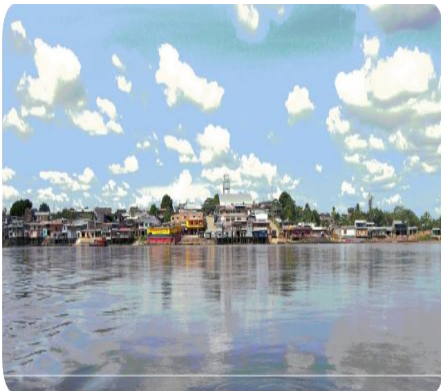
Vista área de Solita